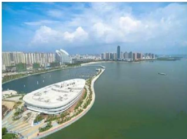
（湛江八景之一金沙湾）