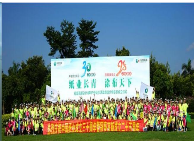
（员工徒步竞走活动）